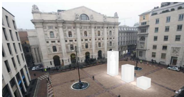
“Histogram” a Piazza Affari

La pptArt nasce dalla collaborazione di un gruppo di MBA e di artisti per contribuire a rettificare una distorta e semplicistica percezione della complessità del mondo aziendale. A distanza di soli sei mesi dal lancio del suo manifesto on-line che afferma che “l’azienda, in quanto dotata di una sua intrinseca complessità e bellezza, può essere oggetto d’arte”, pptArt ha raccolto oltre 2.000 sottoscrizioni da 75 Paesi diversi, diventando quindi il movimento artistico contemporaneo con la più rapida diffusione internazionale.