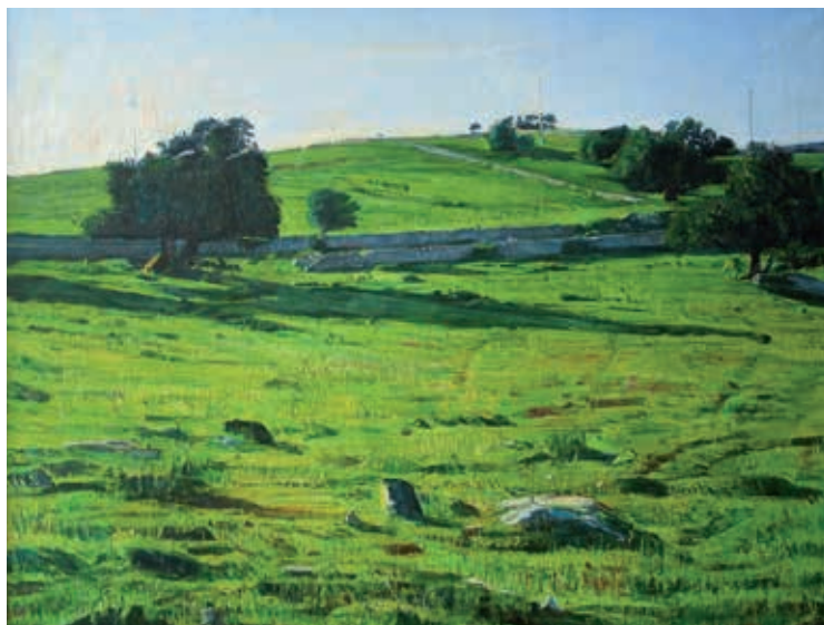
Giovanni La Cognata / Paesaggio con figura / 1996 / Olio su tela / 100 x 130 cm