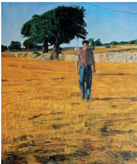
Giovanni La Cognata / Paesaggio / 1996 / Olio su tela / 130 x 110 cm

Queste opere trovano sede negli uffici di AXA ART Italia, a Milano.