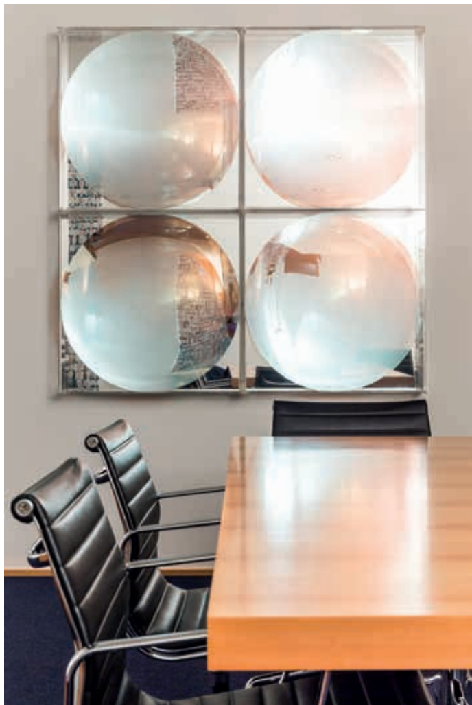
AXA ART / Corporate Collection. Adolph Luther, Mirror and acrylic glass, 1976

Vantiamo legami stretti in tutto il mercato dei broker assicurativi con accesso diretto ad una vasta rete di restauratori, trasportatori e imballatori anche internazionali. Ciò significa che siamo in grado di offrire una gamma estremamente competitiva e flessibile di polizze, sostenuta da conoscenze specifiche e concrete nella cura dei vostri pezzi più preziosi e fragili.